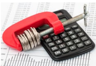
1 Tips voor alle belastingplichtigen

De tips zijn onderverdeeld in zeven categorieën: