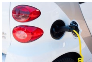
6 Tips voor de automobilist