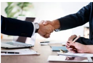
5 Tips voor werkgevers