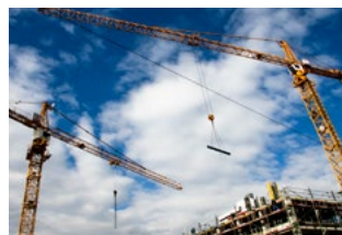
7 Tips voor de woningeigenaar

Graag bekijken we samen met u of het verstandig is om in uw unieke situatie wel of geen stappen te zetten.