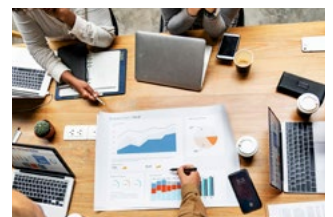
4 Tips voor de bv en de dga