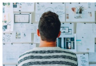
3 Tips voor de ondernemer in de inkomstenbelasting